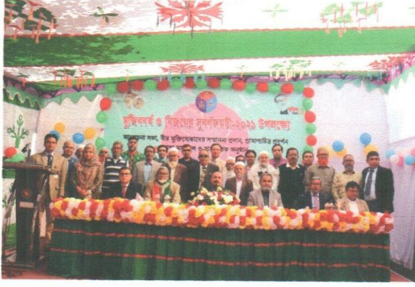
(আমন্ত্রিত কর্মকর্তা ও বীর মুক্তিযোদ্ধাবৃন্দ)