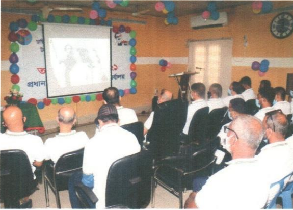
(প্রামাণ্য চিত্র প্রদর্শন)