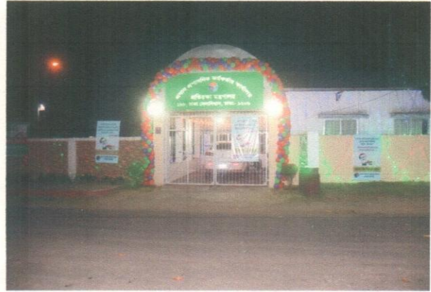
(সজ্জিত অফিস প্রাঙ্গণ)

(খ) সুবর্ণজয়ন্তী উদযাপন : স্বাধীনতার সুবর্ণজয়ন্তী উদযাপনের নিমিত্ত গৃহীত কর্মসূচি নিম্নরূপ :