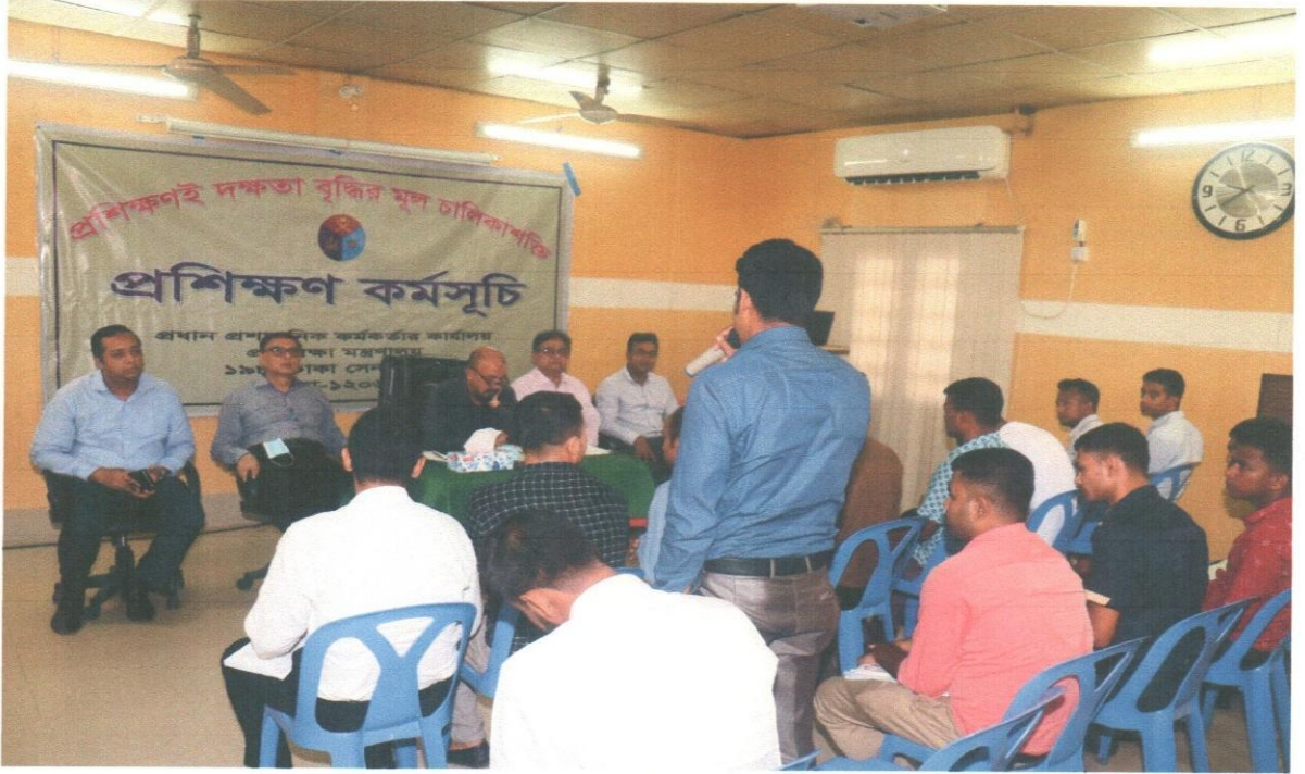
(প্রশিক্ষণ কর্মসূচির উদ্বোধন)