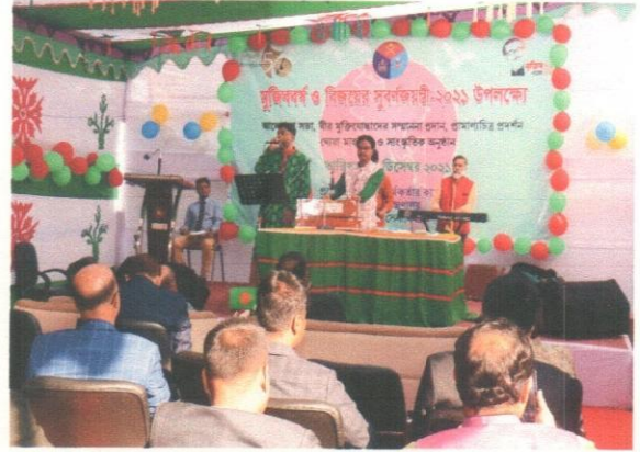
(মুজিববর্ষ ও বিজয়ের সুবর্ণজয়ন্তীতে সাংস্কৃতিক অনুষ্ঠান পরিবেশন)