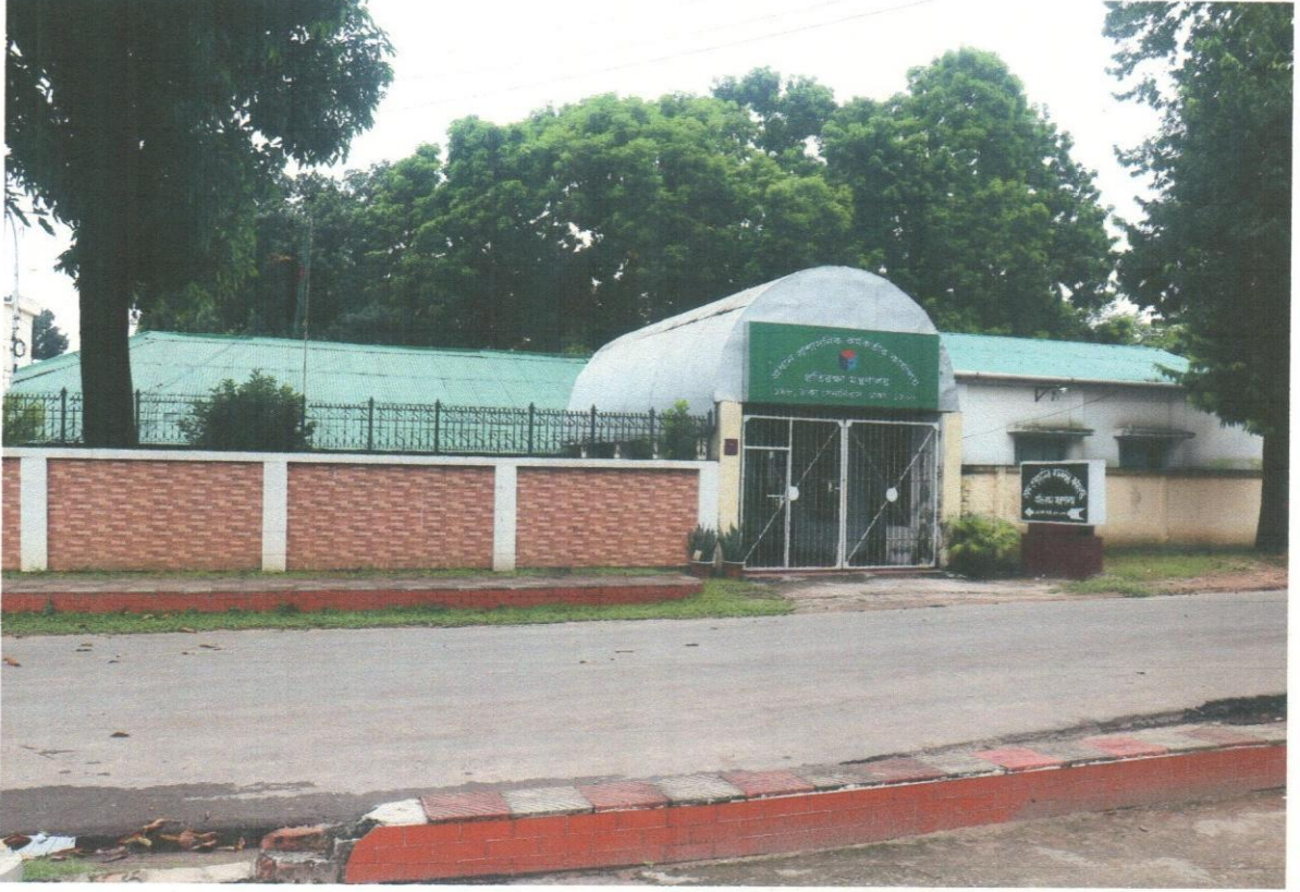
(প্রধান প্রশাসনিক কর্মকর্তার কার্যালয়)

কালের পরিক্রমায় প্রধান প্রশাসনিক কর্মকর্তার কার্যালয়টি বিভিন্ন স্থান পরিবর্তনের পর ১৯৮৪ সালে ১৯৮, ঢাকা সেনানিবাস, ঢাকায় পাকিস্তান আমলে নির্মিত একটি টিন শেড ভবনে কার্যক্রম শুরু করে। বর্তমানে টিন শেডের এ ভবনটি অতি পুরাতন হওয়ায় একটি নতুন ইমারত নির্মাণ করতঃ এ কার্যালয় স্থানান্তরের বিষয়টি সেনাসদরের সক্রিয় বিবেচনাধীন আছে।