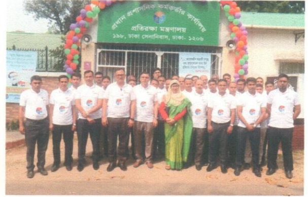
(মুজিববর্ষ অনুষ্ঠানে আমন্ত্রিত অতিথিবৃন্দ)