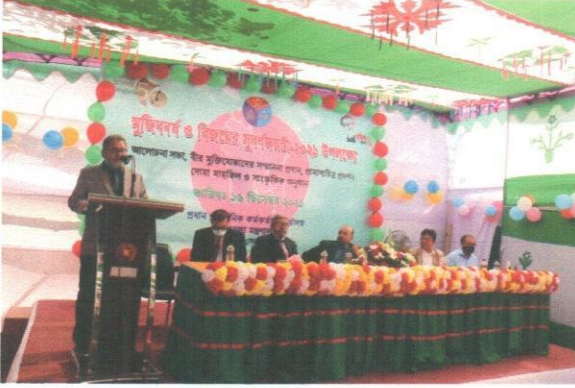
(মুজিববর্ষ ও বিজয়ের সুবর্ণজয়ন্তীতে আলোচনা)