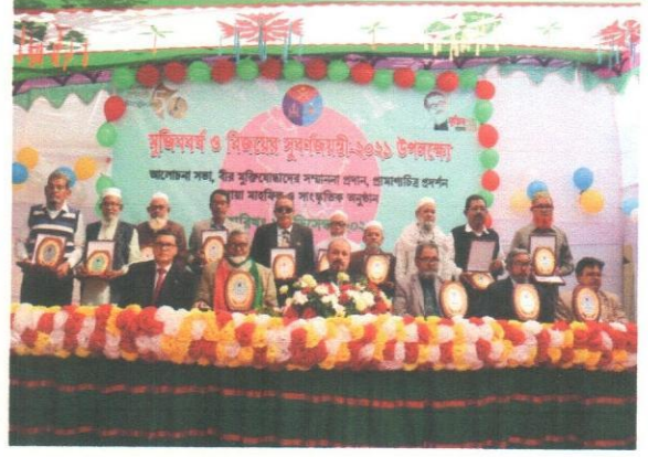
(ট্রেস্ট হাতে বীর মুক্তিযোদ্ধাবৃন্দ)