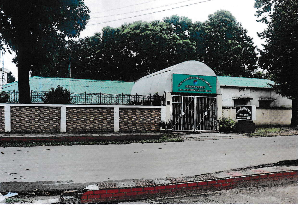
(প্রধান প্রশাসনিক কর্মকর্তার কার্যালয়)

প্রধান প্রশাসনিক কর্মকর্তার কার্যালয় স্বাধীনতা পরবর্তী ১৯৭৬ সাল পর্যন্ত প্রতিরক্ষা মন্ত্রণালয়, পুরাতন হাইকোর্ট ভবনে অবস্থিত ছিল। পরবর্তীতে বাহিনী সদর দপ্তর ও আন্তঃবাহিনী সংস্থাসমূহের সাথে দাপ্তরিক কার্যক্রম পরিচালনার সুবিধার্থে প্রধান প্রশাসনিক কর্মকর্তার কার্যালয় ১৯৮৪ সালে ১৯৮, ঢাকা সেনানিবাস, ঢাকায় স্থানান্তরিত হয়ে একটি টিন শেড ভবনে কার্যক্রম শুরু করে।