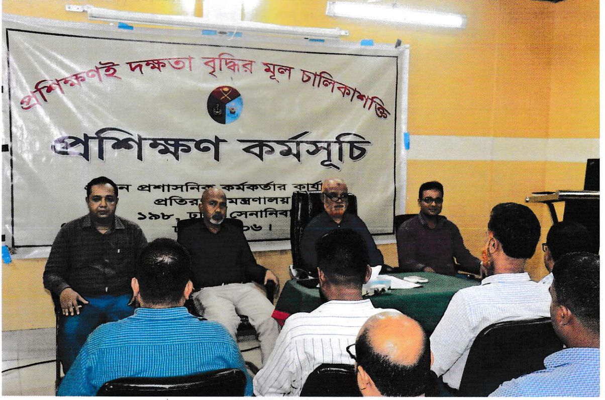
(প্রশিক্ষণ কর্মসূচির উদ্বোধন)